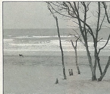
美麗而且乾淨的沙灘