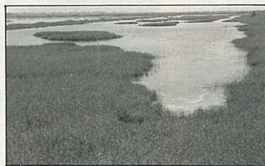
沿海沼澤區，綠意可人。