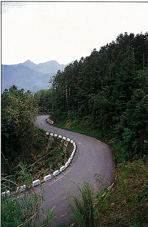
梅山茶園多分佈在公路旁