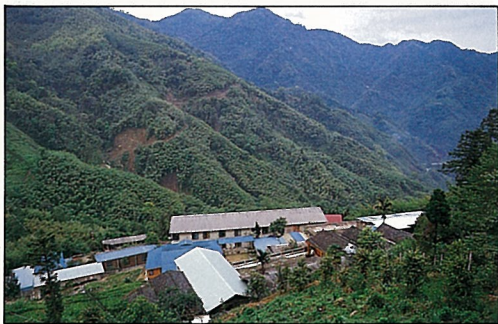
梅山茶園晨昏雲霧籠罩

梅山茶區的特色為面積集中，海拔高，位於群山峻嶺之中，風景秀麗，具有高山茶園之特殊景觀。本茶區有如世外桃源，又與阿里山、瑞里、瑞峰、太平等風景區連線，必可吸引大批遊客前來品茗，及享受大自然的寧靜。 ■