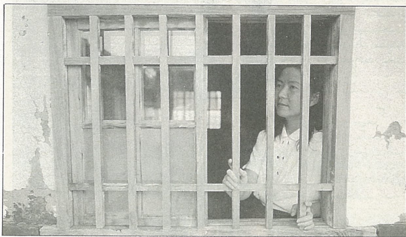
舊式窗櫺，古意盎然。