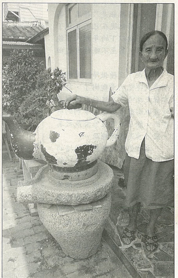
侯家莊是台灣的長壽村