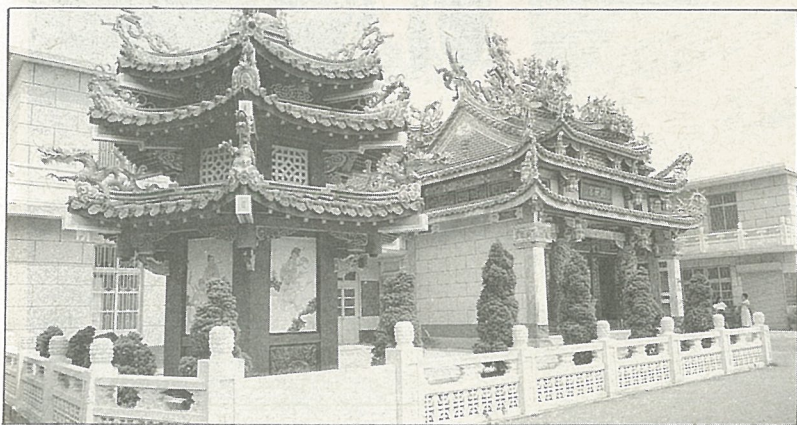
德安宮是村民活動中心