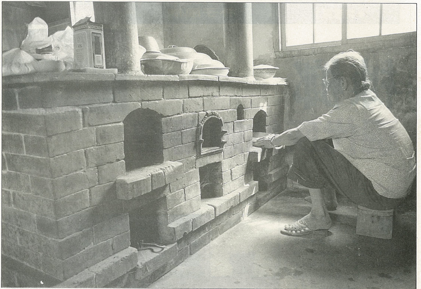
老式大灶仍然管用