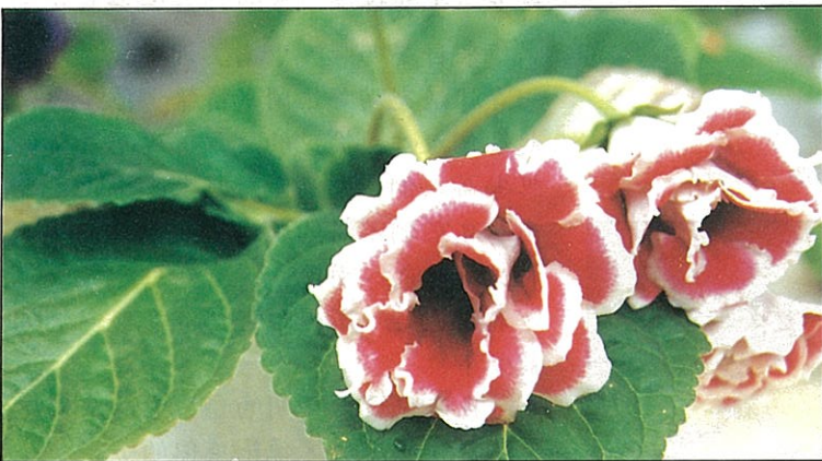
重瓣鑲邊大岩桐，有華麗之美。