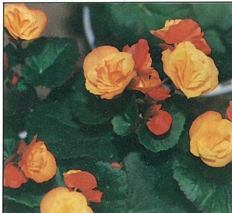
橙黃麗格海棠是搶眼的冬季盆花。