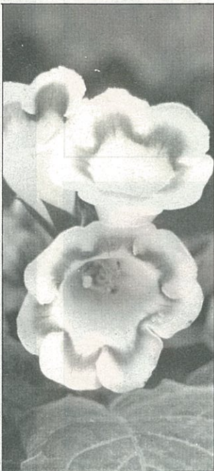
單瓣鑲紫邊大岩桐，十分出色。

大岩桐為多年生球根花卉，喜明亮散射光處，忌強烈陽光直射；但光線不足易徒長且會影響開花，因此窗邊或明亮的陽台較合適。栽培土壤以肥沃砂質土壤為佳，但須注意排水須良好，以防塊莖腐爛。澆水時，須注意勿澆至花面及葉片上，以免產生斑點或腐爛，影響觀賞期，最好由葉隙或盆緣澆入水。生長期每月酌施一次有機肥或化學合成肥均可，觀賞期可停止施肥。繁殖可以播種、扦插或分球法於春或秋季進行。另秋季花後，植株地上部將漸枯萎，進入休眠期，須漸減少澆水量，待完全枯萎後置於陰涼處，保持乾燥，翌春再掘出重新栽培即可。