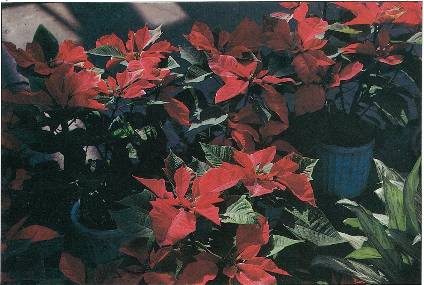
聖誕紅傳統的紅色，仍是大家最喜愛的。