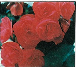
嬌媚的麗格海棠， 是大自然精雕細琢的精品。