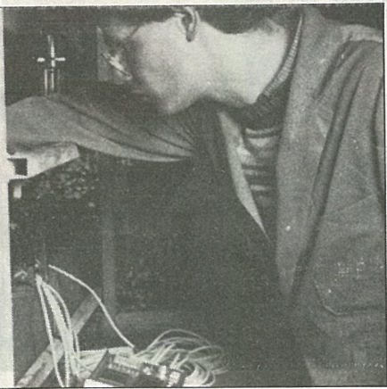
荷蘭洋菇加工業排名世界第三