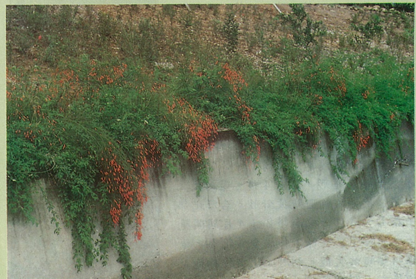
河岸綠美化，以炮竹紅和雲南黃馨合植。