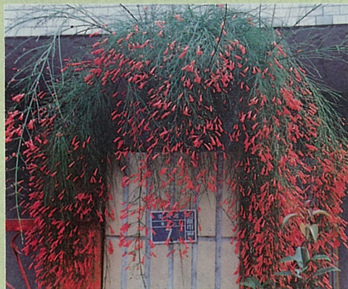
門柱上的炮竹紅，可以取代門牌。

懸垂性植物綠化效果極佳，由庭園、陽台到屋頂都可種植，且栽培管理容易，值得大量推廣。喜歡綠色植物的朋友可以先種幾盆炮竹紅及雲南黃馨美化自己的陽台，再找機會將花苗分株送給鄰居，或當禮物連盆送給親友，既可增進感情又可美化環境。縣市政府農業單位若能設立苗圃大量育苗免費贈送市民栽植，應可迅速看到綠化成果。 ■