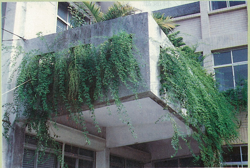
陽台綠化(雲南黃馨)，天天“綠”多。