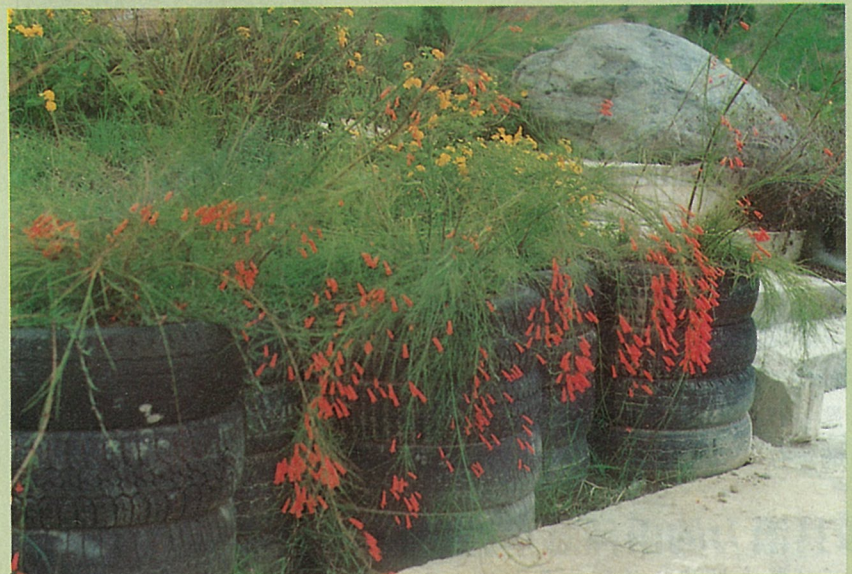
輪胎護坡種植炮竹紅美化

懸垂性植物綠化效果極佳，由庭園、陽台到屋頂都可種植，且栽培管理容易，值得大量推廣。喜歡綠色植物的朋友可以先種幾盆炮竹紅及雲南黃馨美化自己的陽台，再找機會將花苗分株送給鄰居，或當禮物連盆送給親友，既可增進感情又可美化環境。縣市政府農業單位若能設立苗圃大量育苗免費贈送市民栽植，應可迅速看到綠化成果。 ■