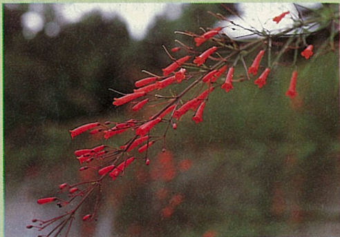
炮竹紅又名花丁子，小花管特寫。