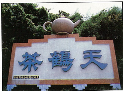
巨型茶壺十分醒目