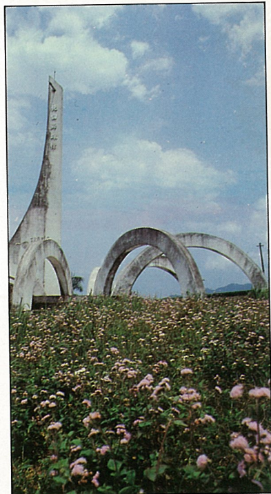
北迴歸線標誌豎立在舞鶴台地上