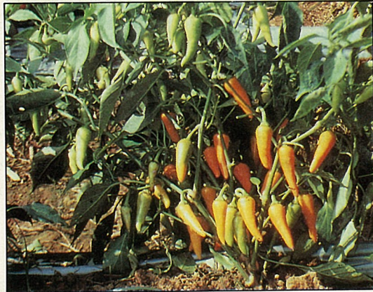
觀賞辣椒宜種在陽光充足之處