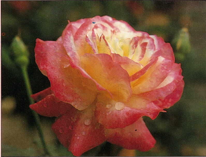
玫瑰是人見人愛的大眾花卉