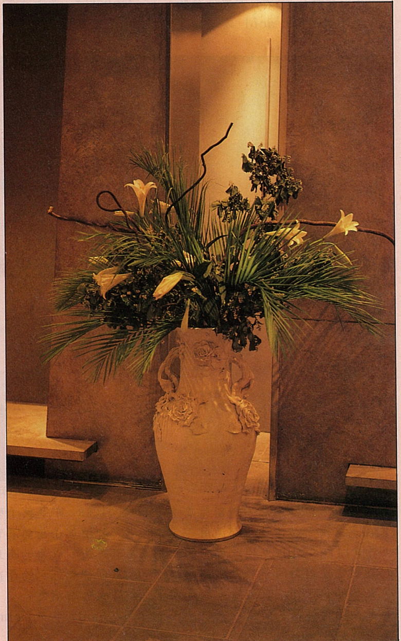
鐵砲百合——是台灣原產