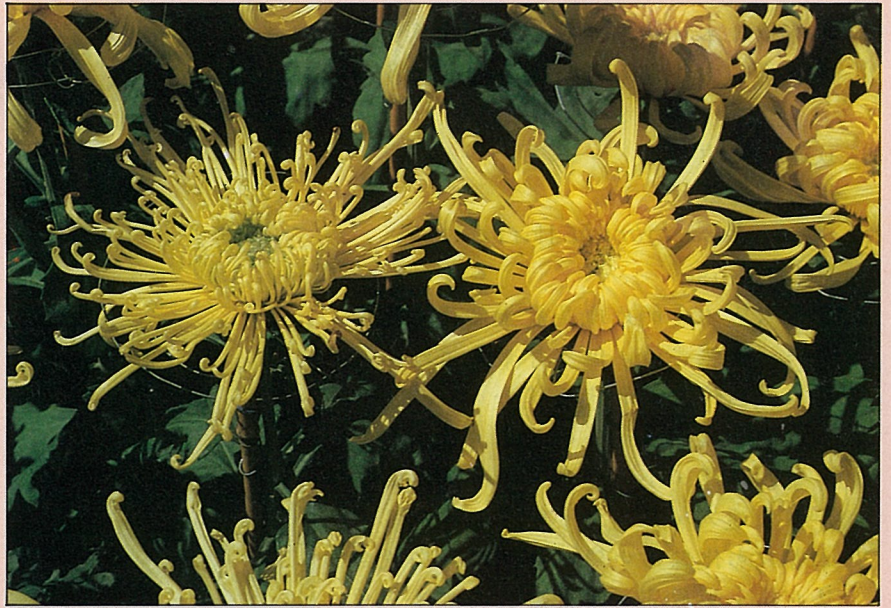
菊花是省產花卉的代表

介紹完這八大金釵，相信你對省產花卉有更深一層的認識。然對於整個花卉產業的健全及進展，仍須賴各位業者與農政單位配合，共同開發市場，調節生產結構，提高生產效率，為省產花卉開闢一個根基穩固、昌盛興隆的王國。