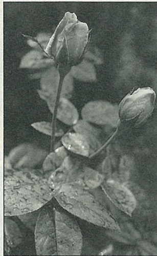
情人的最愛……玫瑰

中市北屯區及北部郊區為主要產區，2~5月為盛產期。目前多以設施栽培，全年均產，主要供應國內市場消費，部分外銷至香港。