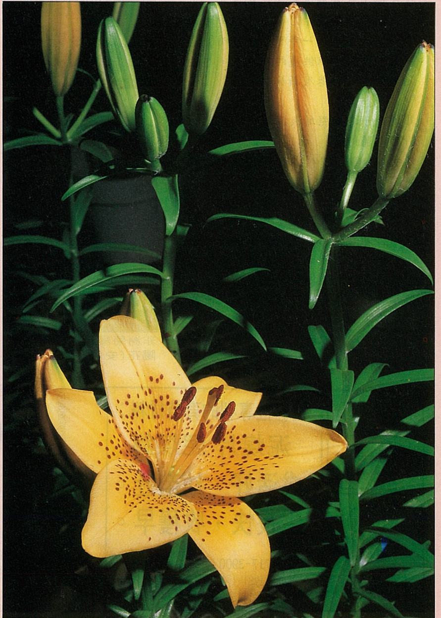
新興切花——姬百合。