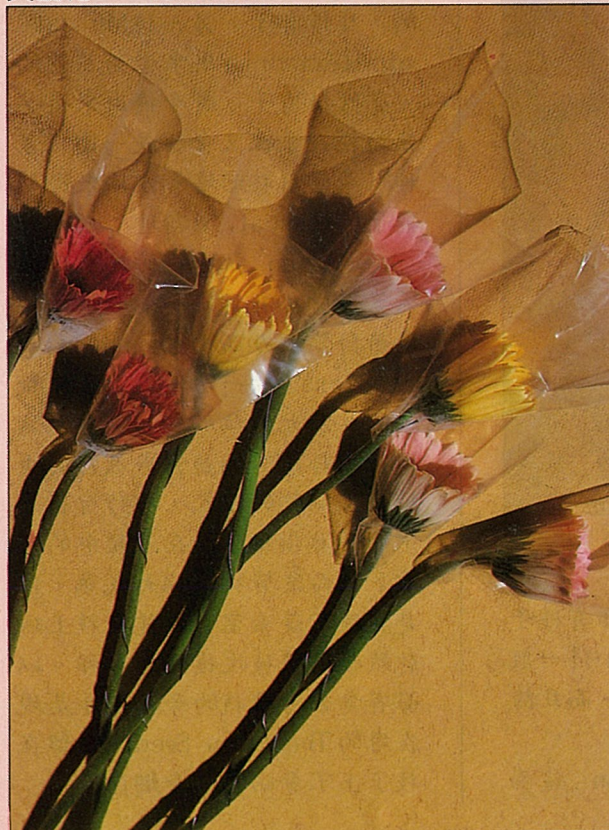
經整理後，準備送到市場的非洲菊(安純 攝) 鄉間小路 79年11月12日