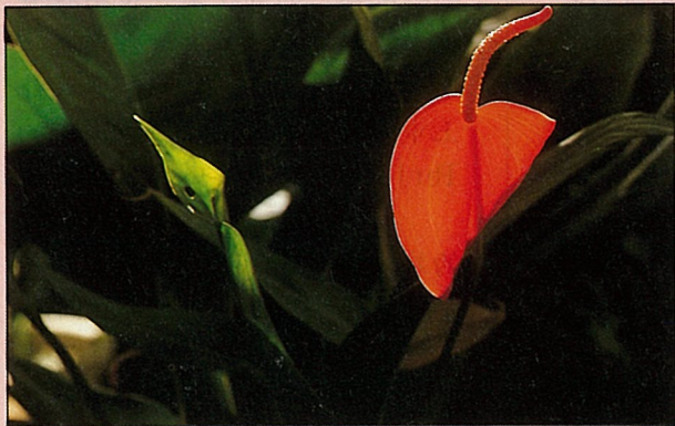
火鶴花——花葉俱美。