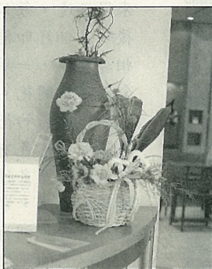
以康乃馨作家飾，充滿溫馨之美

台灣四季如春的氣候，最適於發展花卉事業，近年來在農政單位的大力推廣下，更是成效卓著，不僅在產量上大幅提昇，品質優良更是業者努力達成的目標。菊花一直是省產花卉中最具代表性的，其次為唐菖蒲（即劍蘭），都是出口大宗，玫瑰則以內銷為主。除了它們，你或許不知道還有多種省產花卉的品質及產量也是呱呱叫的呢！如康乃馨、非洲菊、百合、天堂鳥、火鶴，這八大金釵就是今天的主角。