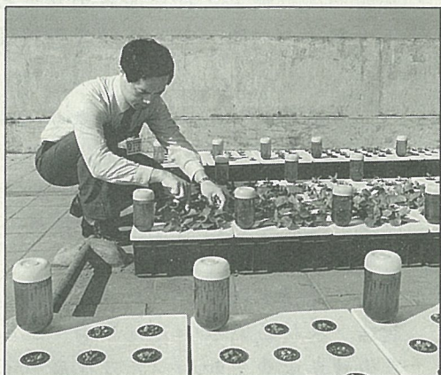
用小剪刀剪除弱小過多之苗代替間拔