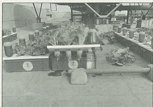
水耕栽培根部生長情形

收成的蔬菜，不妨分送左鄰右舍共享，可發揮敦親睦鄰，守望相助的效果。尤其在颱風或梅雨季節，可不受菜價節節上升的影響，不必看天吃“菜”，好處多多。