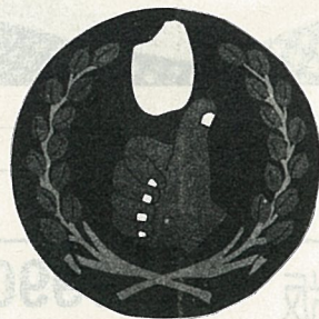
特級良質米服務標章

選擇適合消費大眾的主題製作各類宣導短片，並透過國內三家電視台及電影院播出，以傳達重要的食品及營養概念。