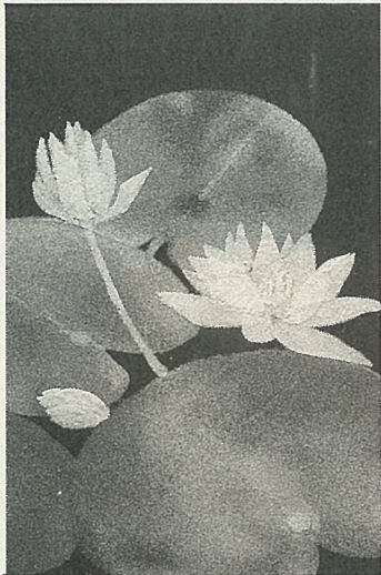
沙畫作品——荷花 〈請看第6頁〉