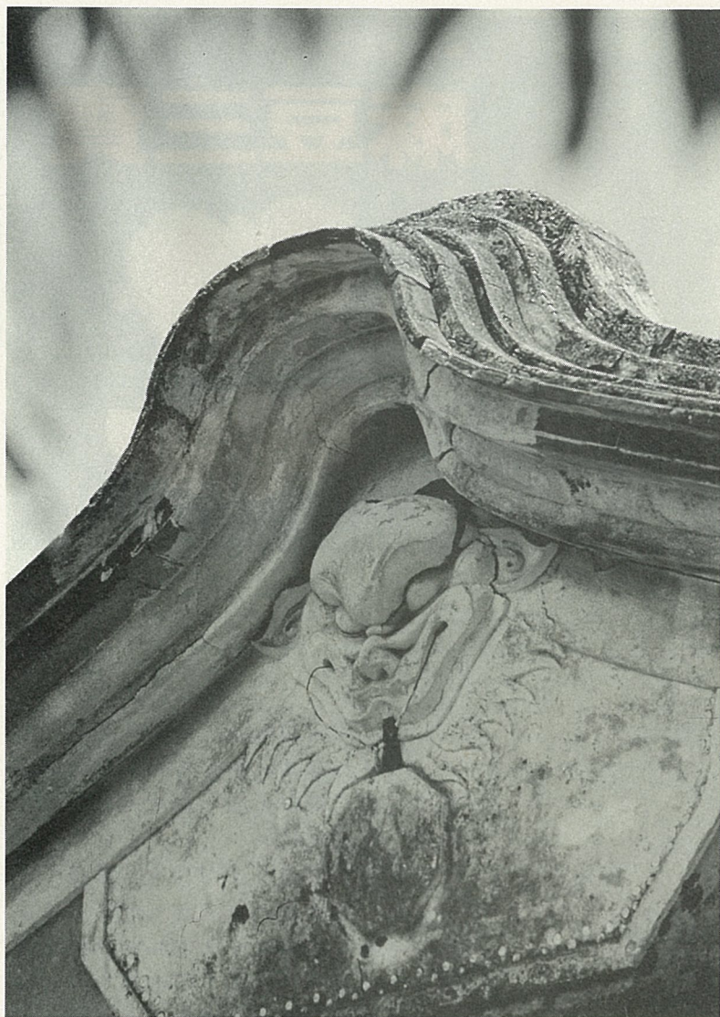
麻豆鎮是個古老小鎮。圖為新四房翹脊之圖飾母獅像。

五王廟的管理相當好，熱心地方公益事業，過去尚年年舉辦全國“五王盃”球類賽，數千選手聚集，盛況空前，多年前，又在後殿空地，增建數十公尺高的巨龍，可沿石階至龍首、龍尾，登