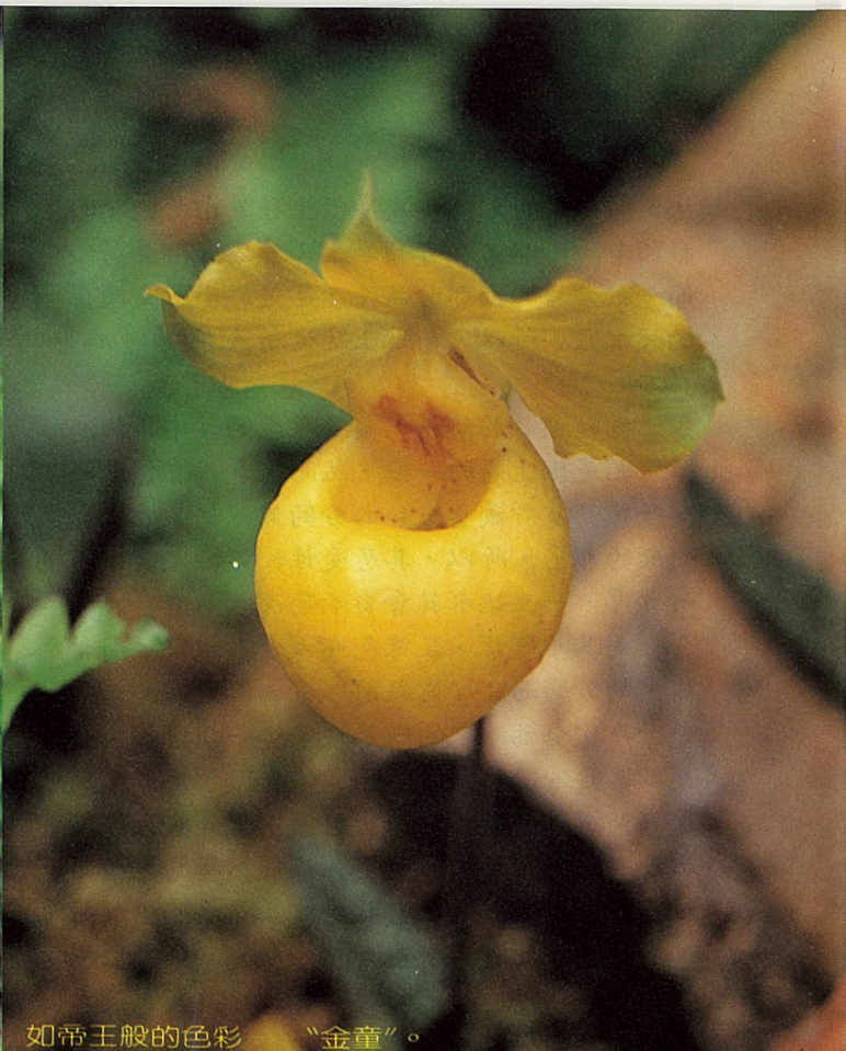
如帝王般的色彩 “金童”。