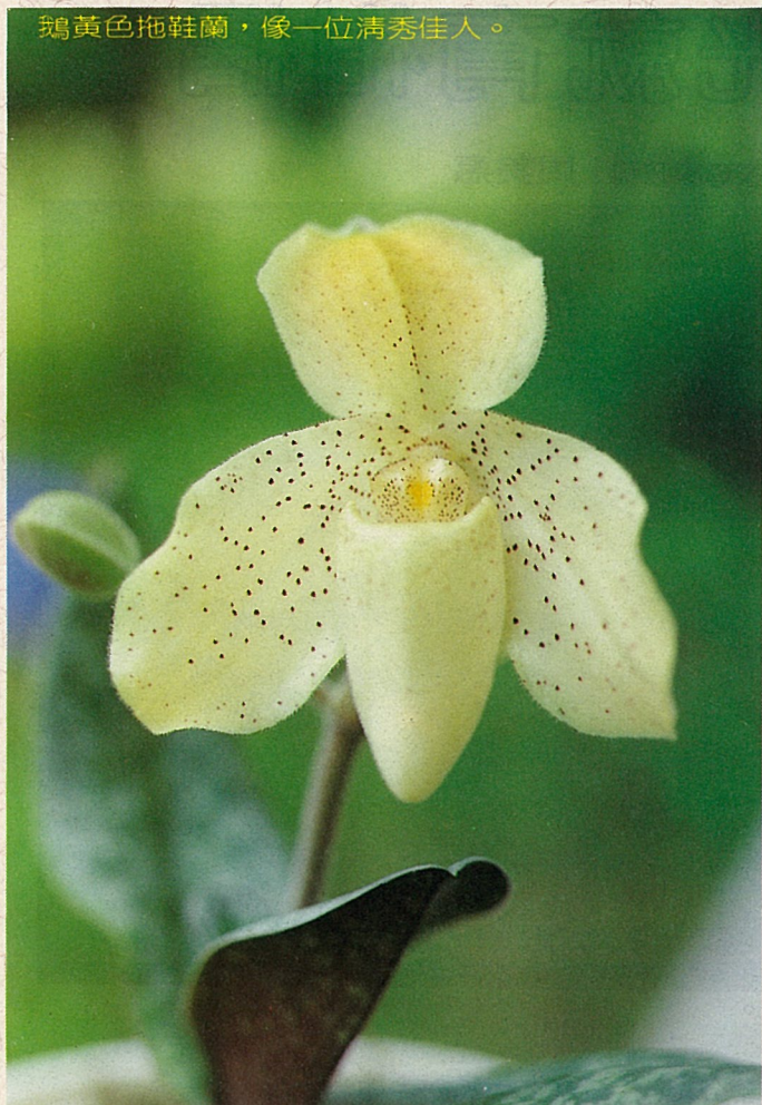
鵝黃色拖鞋蘭，像一位清秀佳人。