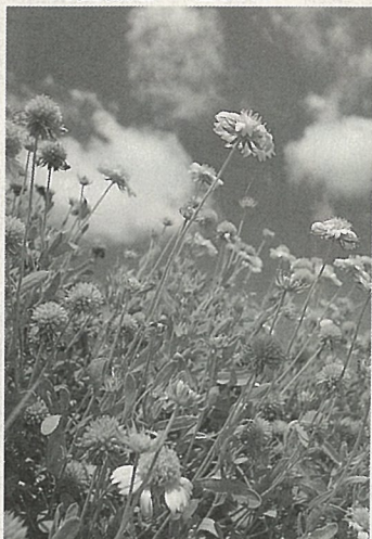
高雄區農業改良場 澎湖分場的天人菊新 品系〈請看第4頁〉