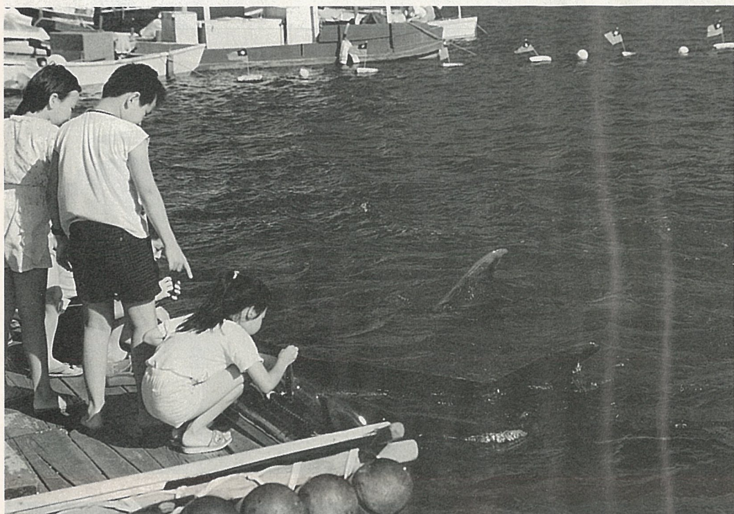
拿魚料餵海豚，孩子們最開心。