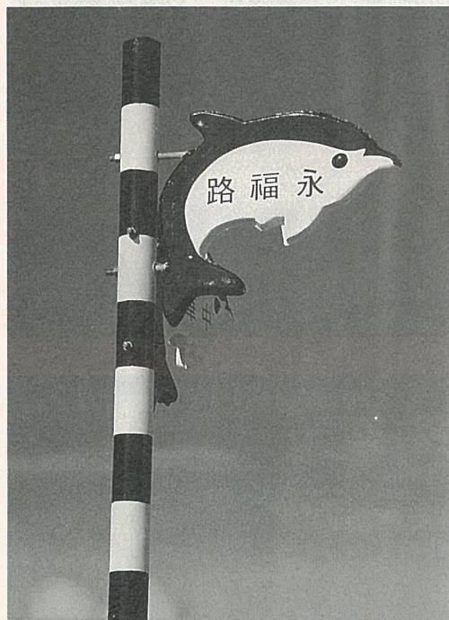
澎湖馬公市的街道路牌，採用海豚造型，很有特色。