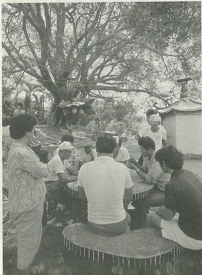
開庄伯公廟前是庄民休閒聚集之處

美 濃鎮位於高雄縣的東北角，高雄市的西北方，形如坐蛙狀。境內東北面皆為山脈，東以茶頂山與六龜鄉為鄰，西以過溝溪接“香蕉王國”旗山鎮，北以靈山、月光山、雙峰山連杉林鄉，南以荖濃溪、高屏溪，分別與屏東縣高樹鄉為界。全鎮面積約 120 平方公里，境內極少丘陵地，為一平坦的平原。由於地位適中，四季氣候溫和，土地肥沃，盛產稻米、香蕉、菸葉等，是高雄縣的穀倉，也是昔日的菸草王國。