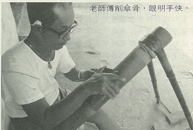
老師傅削傘骨，眼明手快。