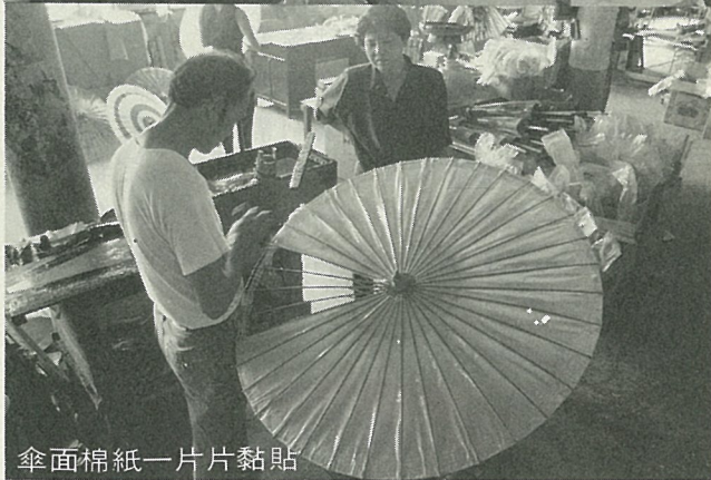
傘面棉紙一片片黏貼

儘管洋傘已大量問世，但美濃的客家人，對於中國傳統藝術和色彩的結晶——紙傘，興趣仍濃厚，且幾乎家家戶戶都備有紙傘，例如：女兒要出嫁，紙傘就列為必備的嫁粧；男孩子16歲的成年禮上，父母親也要送他一把紙傘，作為禮物。