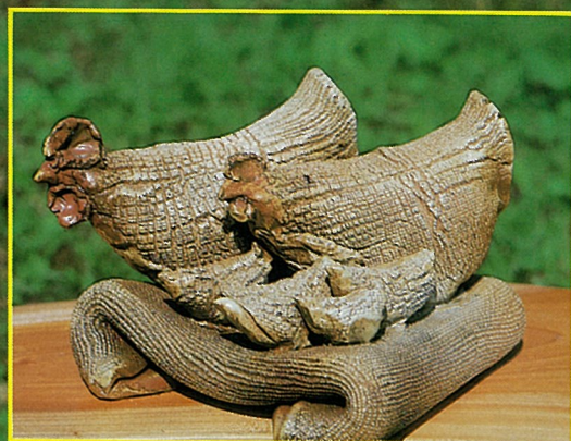
4 會明男的陶藝作品