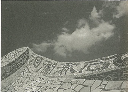
花蓮市的大理石藝術景觀 請看第21頁