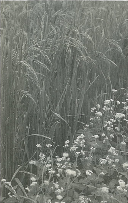
花蓮光復鄉的紅糯米 請看第16頁