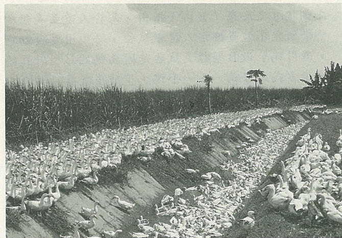
過溪宿溪，逢田吃田。