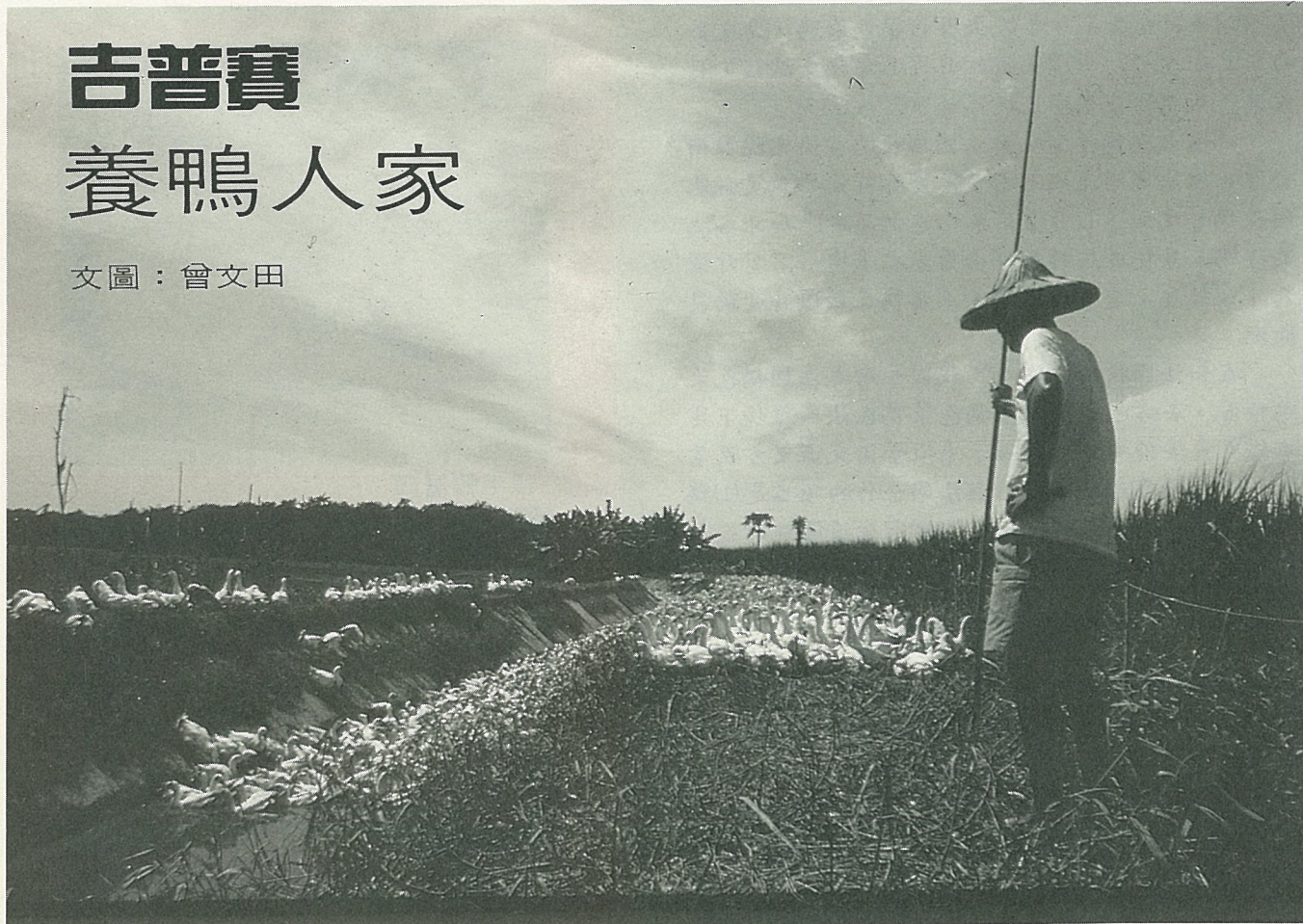
拄著竹竿，守著鴨群。