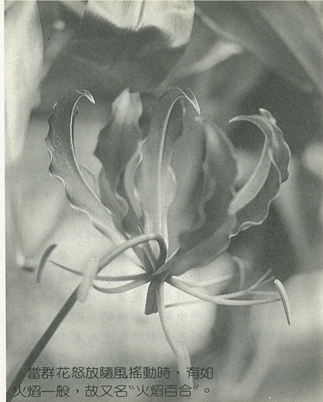
當群花怒放隨風搖動時，有如火焰一般，故又名“火焰百合”。

百合科家族中，長得最奇特的一員。首先，其植株莖葉均具蔓性，葉端更呈捲曲，可攀緣他物而上，所以，也稱為“蔓百合”或“炬火藤”。