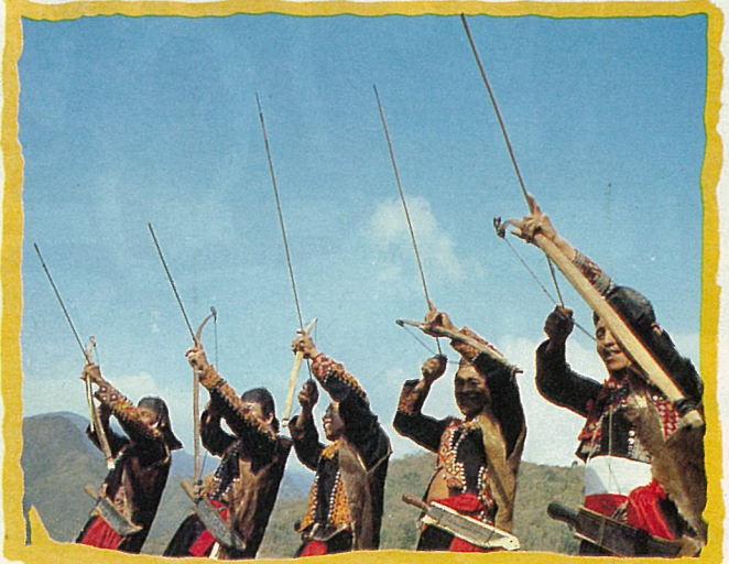
布農族男子個個是狩獵高手