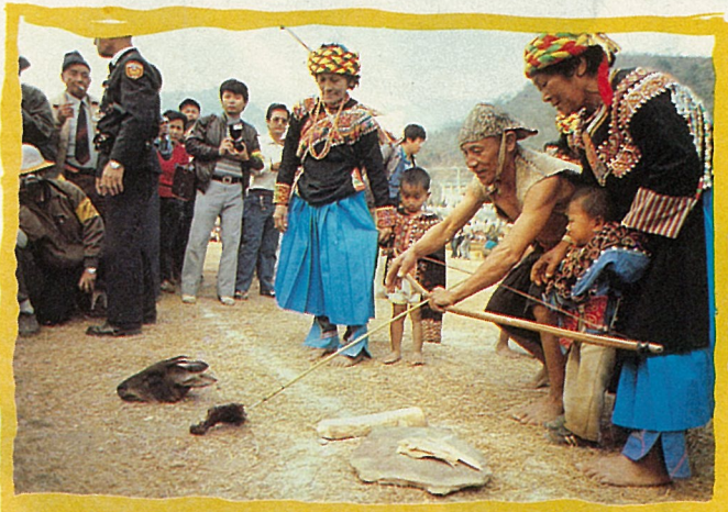
小男孩由父兄代射，但需口唸孩子的名字。