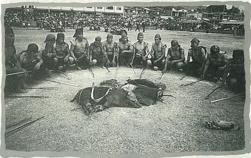
獵者圍著獵獲的山豬

在布農族山胞的習俗中，一年有6個重要的祭典，統稱為“豐年祭”，按節氣分列：1~2月為“開墾祭”，3~4月為“播種祭”，5~6月為“拔草祭”，7~8月為“