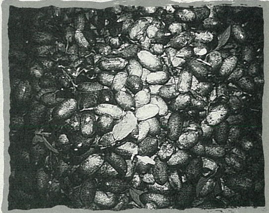
野生愛玉子愈來愈少了