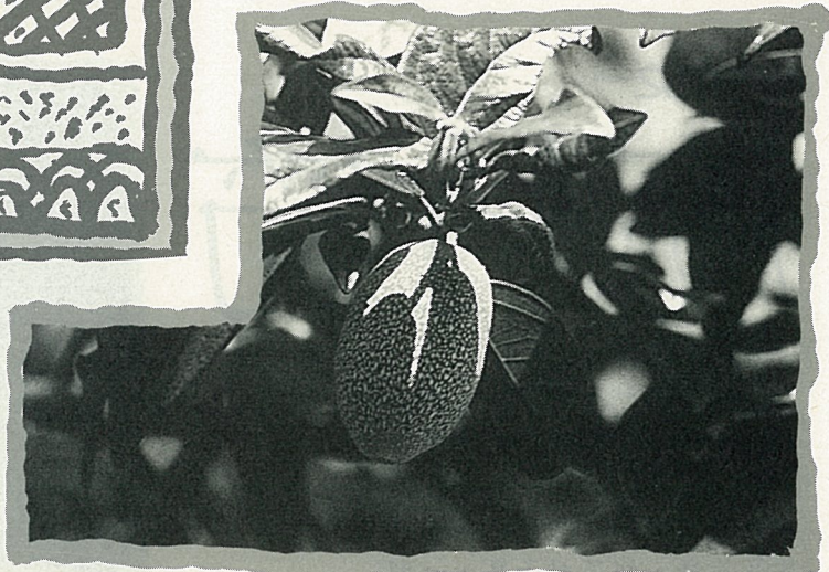
愛玉子是一種「瘦果」