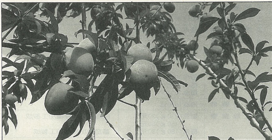
部分果農改種水蜜桃。

6月是本省桃李最肥美的季節，在選購鶯歌桃時，宜挑選果粒大、果形飽滿、果色鮮紅部分多而果實脆者為佳。■