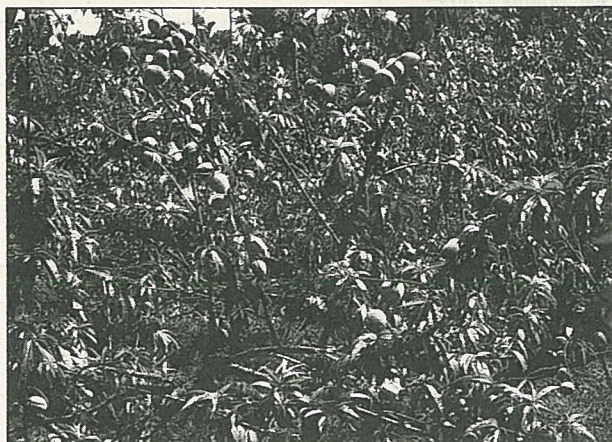
滿園成熟的桃子，歡迎你來採撿。