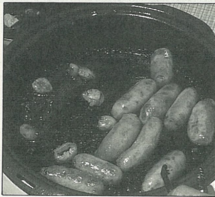
煎雞肉香腸，小火慢煎味道最好。