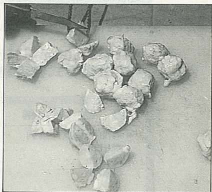
所用雞肉部位，是以里肌為主，吃起來口味佳。