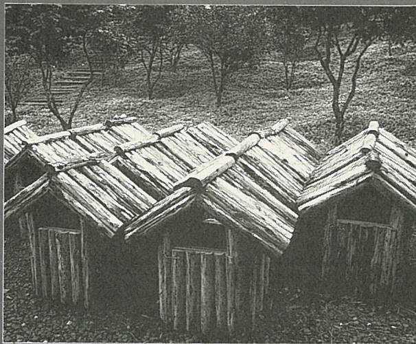
小徑木製作的垃圾箱，與環境搭配自然。