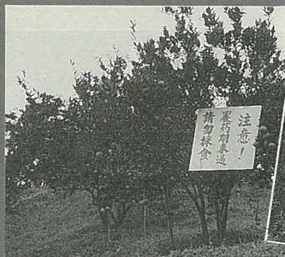
禁採區的警告告示。