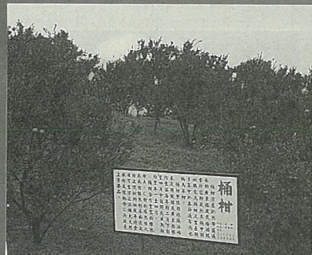
採果區的大型看板，讓遊客認識水果。