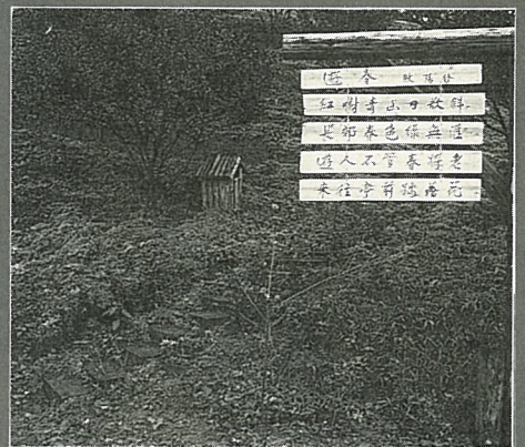
步道兩旁看板，配合節令題上詩詞。

農場的整體設計，包括軟、硬體設施的搭配，均力求自然、合宜，突顯脫俗典雅，又保有鄉村田園之美，如涼亭的精心設計，點綴著幾首詩，步道旁的看板，配合時節題上詩詞，再融合著播放的鄉村音樂或鋼琴名曲，將遊客引入詩情畫意的境界。