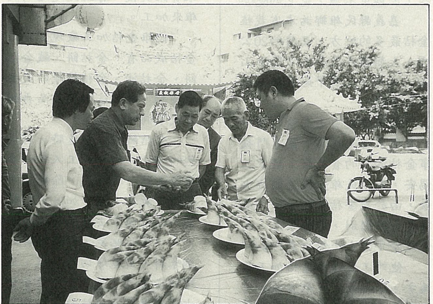
木柵區農會每年均舉辦綠竹筍生產技術比賽會，期使生產技術不斷改進。