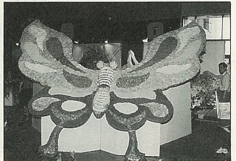
蝴蝶蘭花瓣精心鑲嵌的蝴蝶標誌。

長源旅行社 股份有限公司 UNCLE TRAVEL SERVICE CO., LTD.