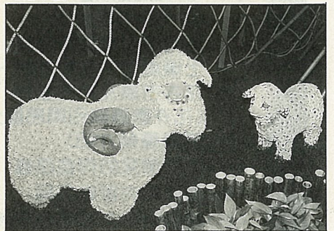
草地上的綿羊，多麼悠閒自得！這是以黃白兩色小菊插成的。