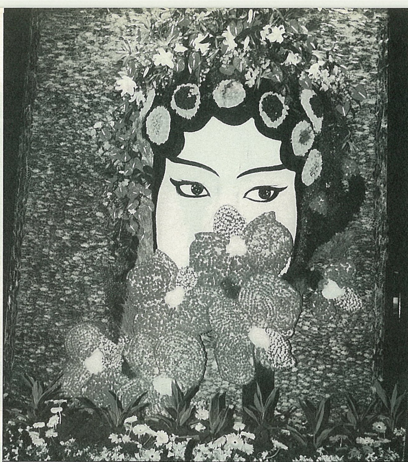
花展標誌——國劇臉譜，在參觀人潮碰觸摸之下，早已花容失色！

意兒？你以為你們是什麼展啊？”咱們費盡唇舌為他們介紹正在播放的MTV內容及展出項目，他老人家不高興的說：“我不看MTV可以吧，我要進去就是了！”要不是咱們有些個“壯丁”蝴蝶仙子，這現場秩序還頗難控制，想來下一屆花展遴選解說員時，體能測驗得放在第一項。