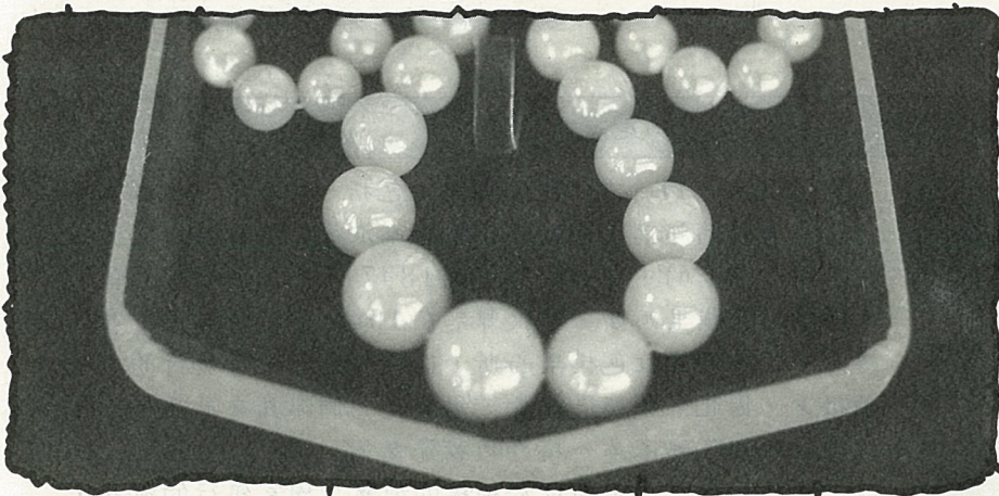
深紅色珊瑚項鍊光澤照人