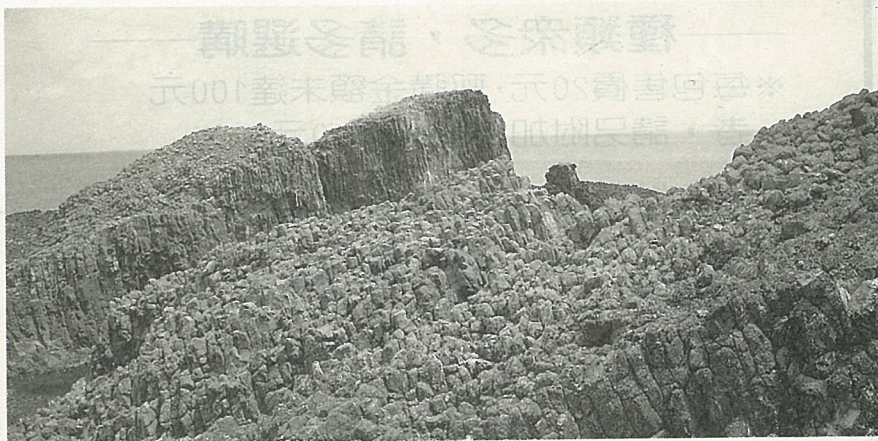
奇特的玄武岩地理景觀。