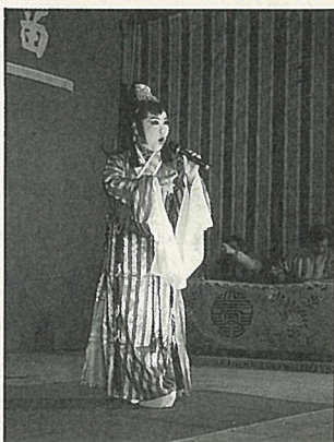
傳統客家唱腔有九腔十八調