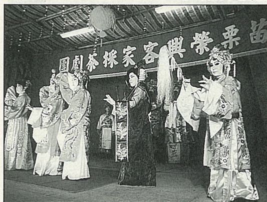
榮興採茶劇團保有客家戲原貌