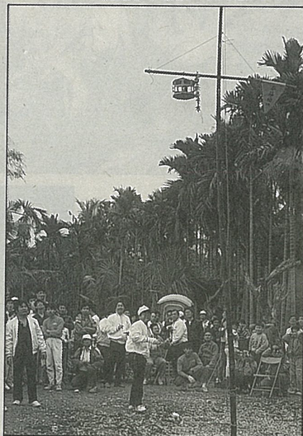
攻炮城的場面非常熱烈