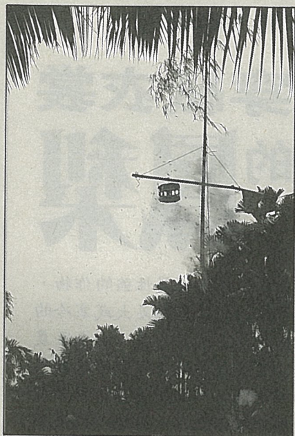
攻炮城是傳統民俗活動

由於場面壯觀，常讓圍觀者看得驚心動魄，不時要躲避不長眼睛的炮屑，又要為炮城老攻不下，而急若星火。一旦炮城被炸爛，鞭炮點燃，炮屑上沖，頓時歡聲雷動，大鬆一口氣。 ■