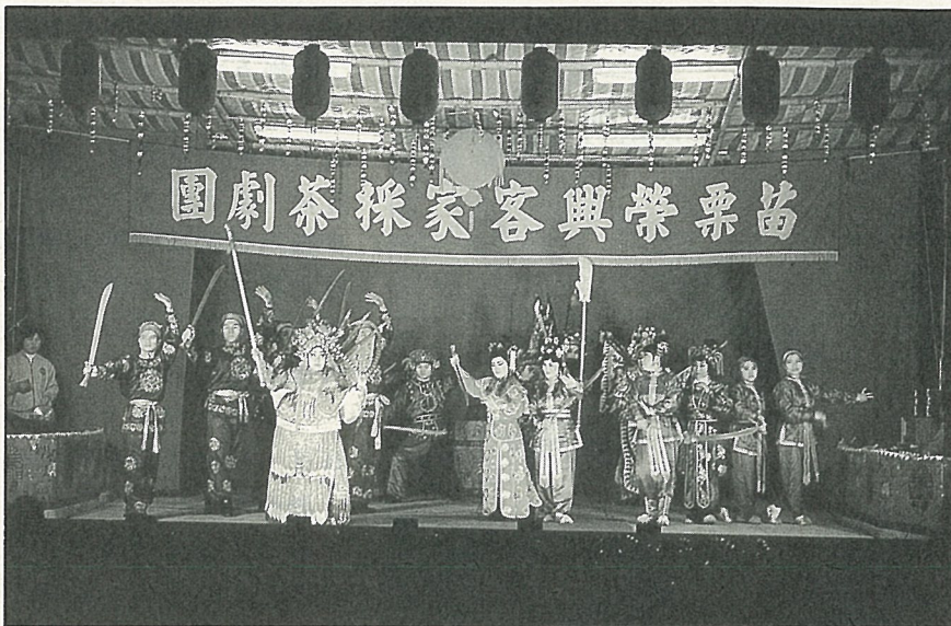
“乞米養狀元”客家戲