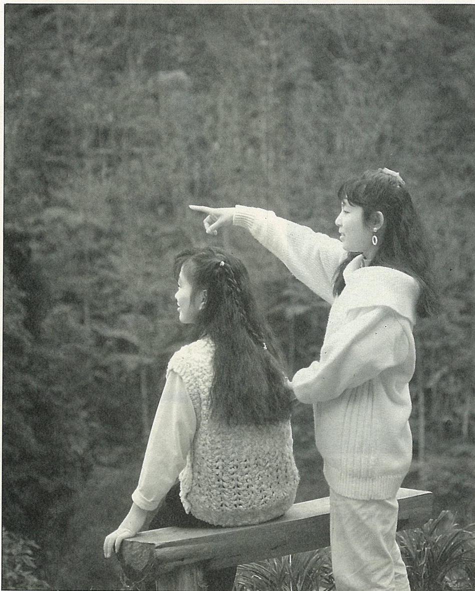
藥園景緻讓人身心舒暢

為配合60多公頃森林藥園天然景緻而設置的小木屋，由於風格別緻，寧靜溫馨，確為忙碌的都市人調劑身心、平衡緊張情緒的世外桃源！