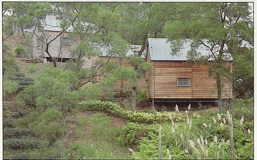
相思林內的小木屋