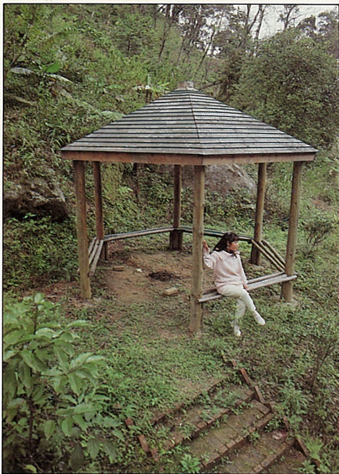
供遊客小憩的木造涼亭