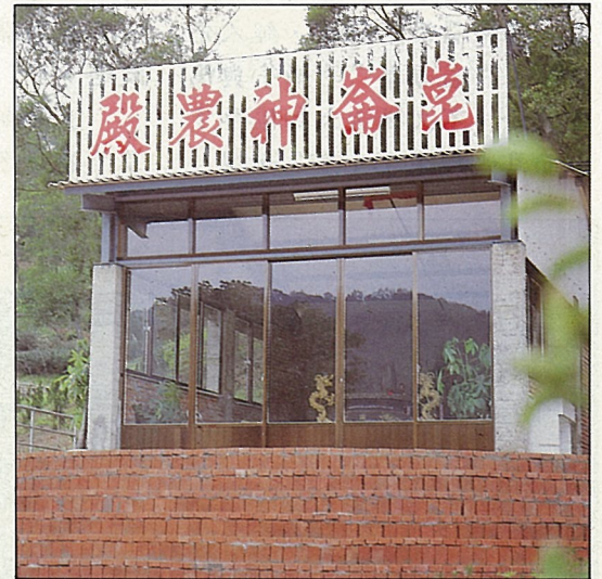
崑崙神農殿內供祀神農大帝