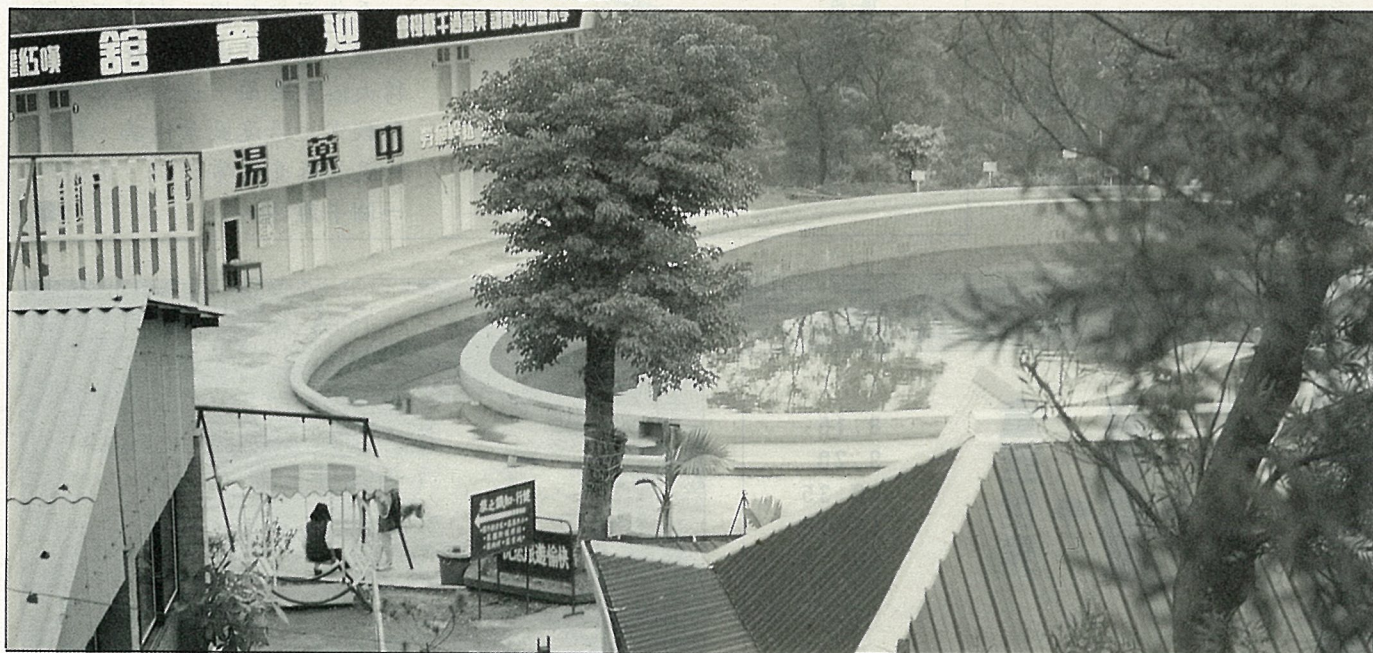
為青少年設置的游泳池