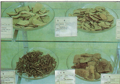
館內展示的各種藥材