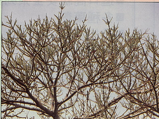
雀榕枝幹上貼滿了小果，吸引各種野鳥。