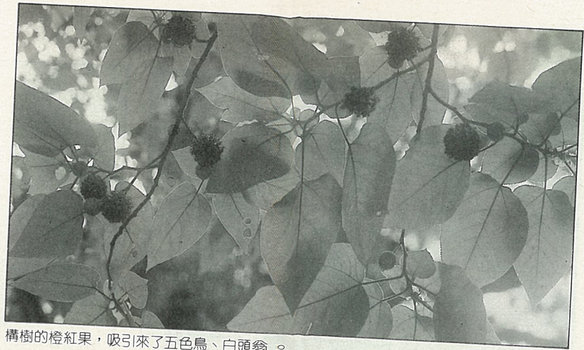
構樹的橙紅果，吸引來了五色鳥、白頭翁。嫩葉也是白頭翁與赤腹鵝所喜食的。

7. 構樹：桑科的落葉喬木，葉形變化很大，多花果呈圓球形，夏季成熟後紅橙、多汁且香甜。蚊蠅金龜子嗜食，鄉下孩童會摘食，鳥兒們也前來爭食。麻雀、五色鳥、白頭翁、紅嘴黑鵝都喜食之。構樹的