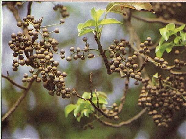
茄冬果雖小，數量却十分驚人。