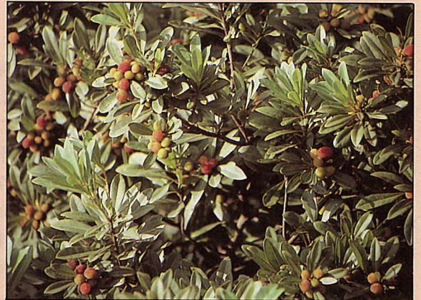
楊梅果酸甜味美又多汁，鳥兒愛吃。