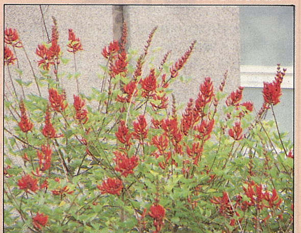
珊瑚刺桐的花色美艷，花期又長，綠繡眼喜食。