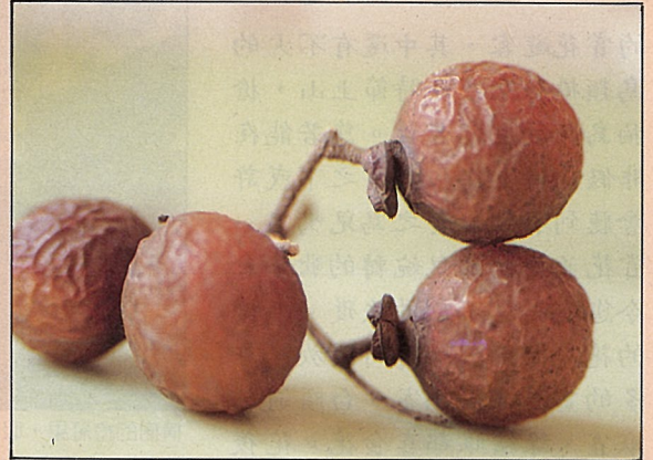
無患子的果實，冠羽畫眉喜食。