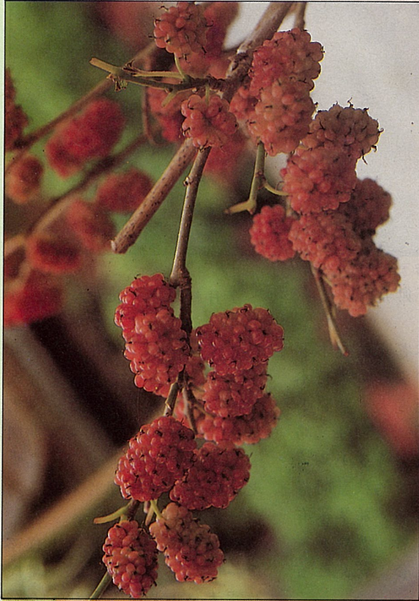
小葉桑甜蜜的果實—桑椹，人與鳥都愛吃。