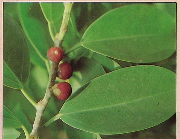
桑科榕屬的紅漿果，是許多鳥兒的最愛。