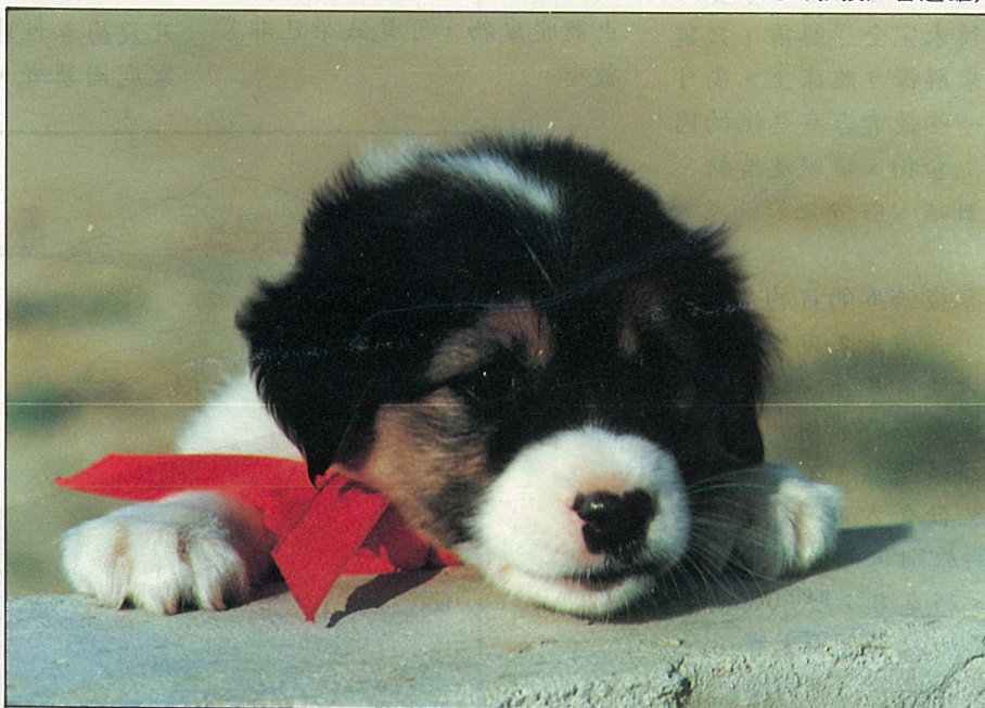
小花狗(善化鎮/林健龍)