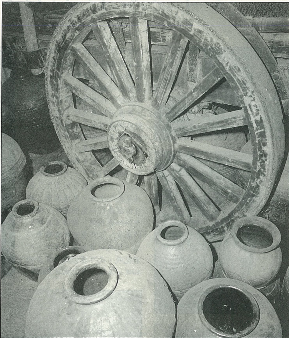
包鐵皮的牛車輪與大甲東陶甕，是民藝品搶手貨。

另一對破舊的竹箱，稱之為“夏籠”，已經有上百年的歷史了。這對老一輩人說為“葉籠”的夏籠，外以竹篾編織，內包蓆葉，具有防水、防潮的功能。它是古時候讀書人上京赴考時，身邊書僮挑負隨身衣物的行李箱。