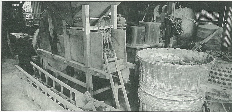
土壟、水車、風鼓組成的農村曲。