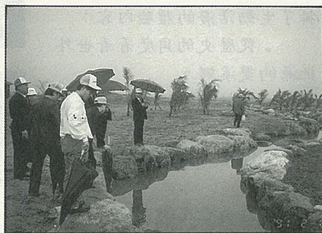
人工溪流裡捉泥鰍