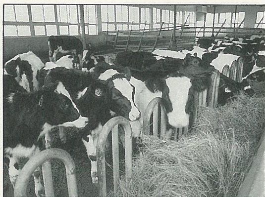
小乳牛喜歡與人親近

在這片開濶的原野上，盡情的笑吧，不必擔心妨礙安寧；開懷的吃吧，不必擔心發胖，因為你必須走很多路，消耗大量卡路里；玩累了，看水牛閒適吃草，白鷺點點其間，情緒自然輕鬆。小朋友還想不想再來？好像只有一位小朋友說不想，他抱怨走路太多。