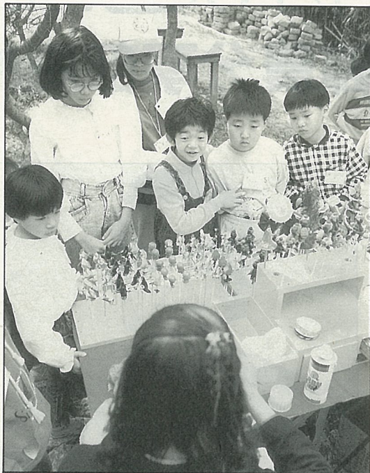
捏麵人表演最受歡迎

此次“休閒農業”“小小羊兒要回家”農業生活體驗營，恒春農場早在舉辦活動之前，即緊鑼密鼓着手各項準備工作，期使活動能辦得更臻完美，以達到推展“休閒農業”的目的。活動分為兩個梯次，計112位來自全省各級學校的男