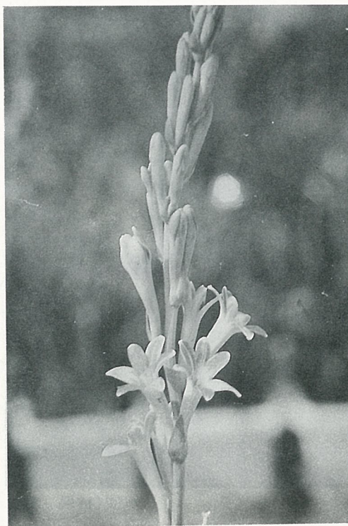
晚香玉應選大球，開花必佳。

週以前，要按每三平方公尺 1~2 水桶的量，施撒腐熟堆肥，再散佈 1~2 大碗的草木灰，然後用鏟挖深 20~30 公分，與土壤充分混合，做好植前的準備。由於球根花卉類要求較多的鉀肥，多用良質的草木灰以提供鉀肥的效果。堆肥絕對需要完全腐熟，如果施用未熟堆肥，容易引起球根的腐敗。尤其水仙類必須注意這一點。