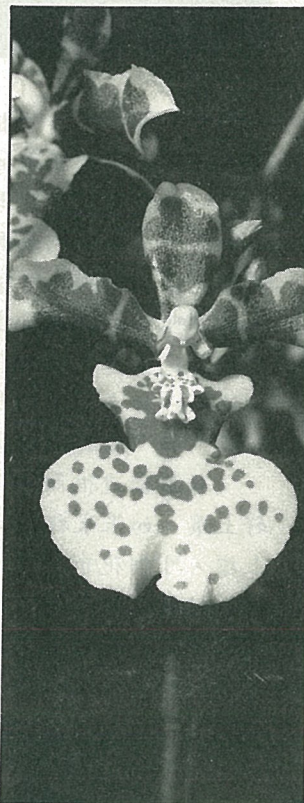
有斑紋的文心蘭

在歐美各國，文心蘭風頭十足，每當有新品種被育出時，就如同我國的藝蘭、蝴蝶蘭那麼般的令人瘋狂！但是，在本省，不論其花色、花型如何的迷人、繁多，却仍然引發不出國人對它的狂熱；或許，是因為起步較晚，使得有“先入為主”觀念的國人，對它總是少了一份親切感罷！