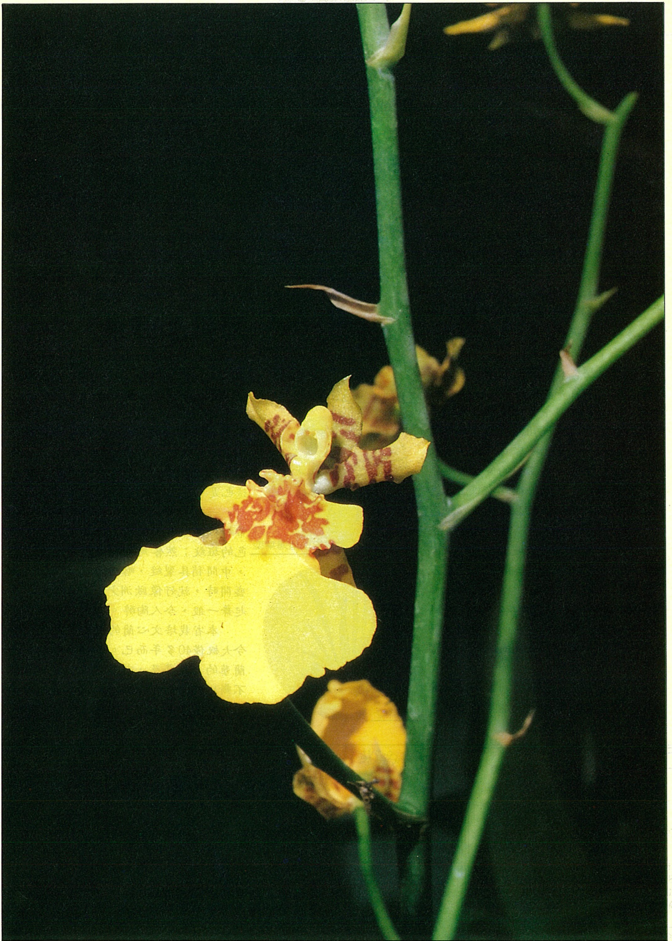
文心蘭特寫——有一個特別大的唇瓣。