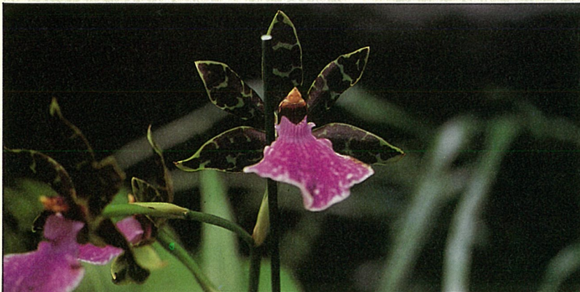
大部份文心蘭的長相，與堇花蘭十分類似。