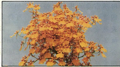
這一株文心蘭，數數看，到底開了幾朵？

這種明朗、快活的花朵，不會傷及嘉德麗亞蘭的端莊雍容，也不會衝突到蝴蝶蘭的單調花色，它那輕鬆活潑的儀態，已在台灣漸露頭角，且越來越受人注目。你有興趣嗎？何妨也來一盆？