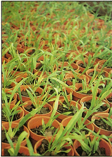
文心蘭大量栽培