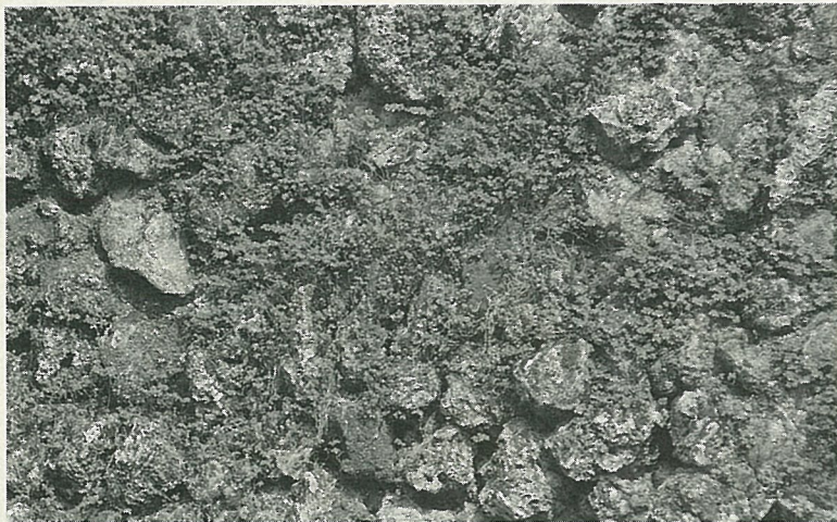
枝葉細緻的小葉冷水麻