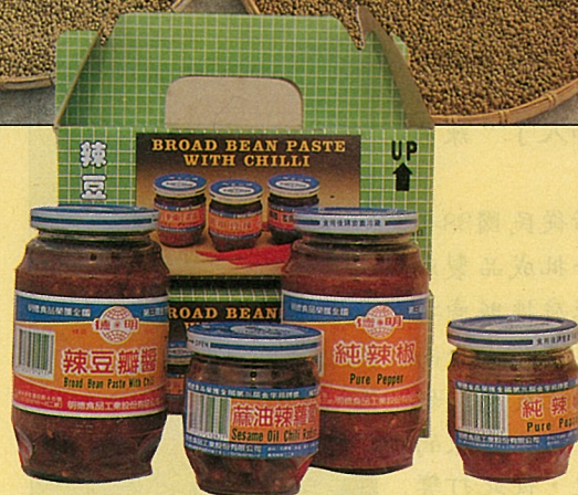
明德食品廠的醬類產品