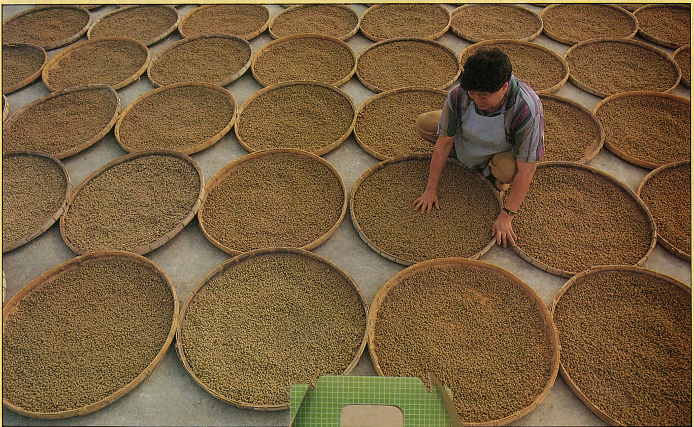
曬蔭鼓製做辣豆瓣醬