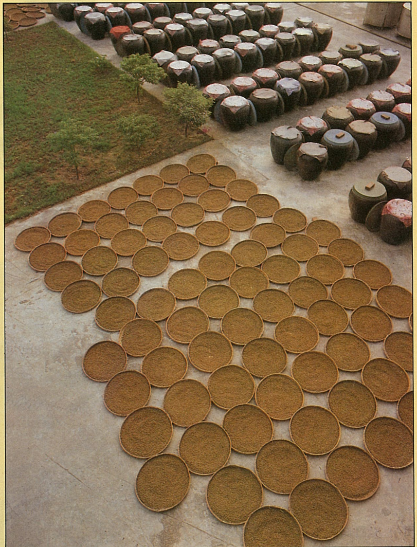
明德食品廠的曬場