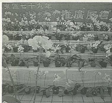
79年台東蝴蝶蘭展售會