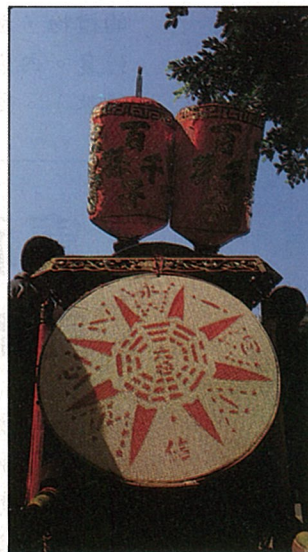
新娘轎後的八卦米篩，有祭煞作用。