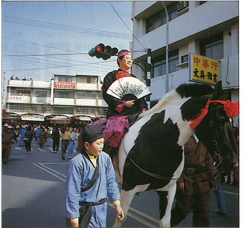
新郎騎馬迎親，手搖春風得意扇。