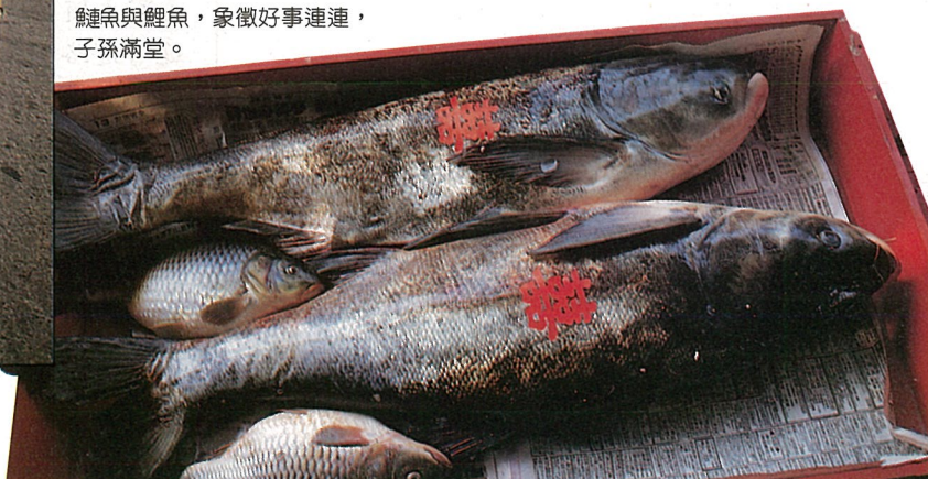
鯉魚與鯪魚，象徵好事連連，子孫滿堂。