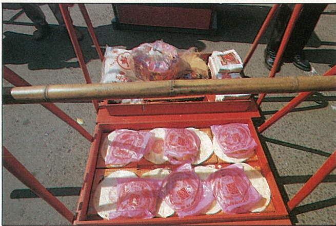
男方送給女方的禮餅。