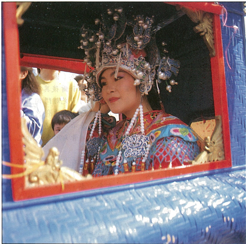
喜孜孜，穿戴鳳冠霞披的新娘子。