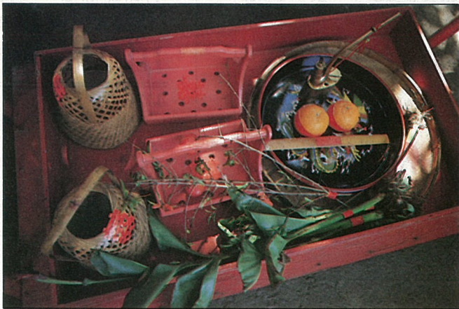
蓮蕉與樹榴，均與生男育女有關聯。