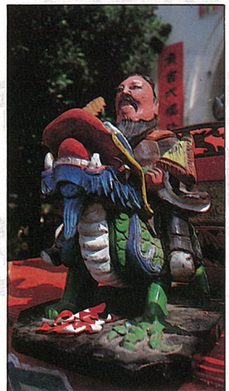
新娘轎頂放置的姜子牙騎麒麟彫像。