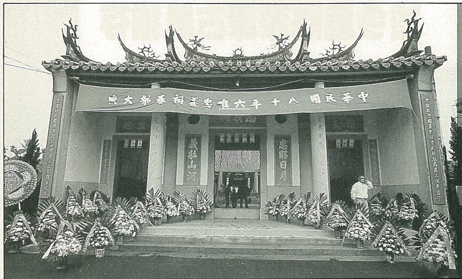
客家節春祭選在忠義祠舉行