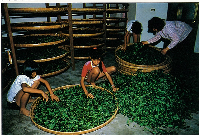
農村人力不足，製茶全家總動員