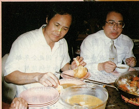
西班牙冷湯營養豐富，吃了不發胖。

汁，加入麵包丁及洋蔥末，及青椒丁，拌着吃，既能果腹又清爽可口，去暑解熱，非常適合本省氣候，且營養豐富又不發胖，亦為減肥良方之一。