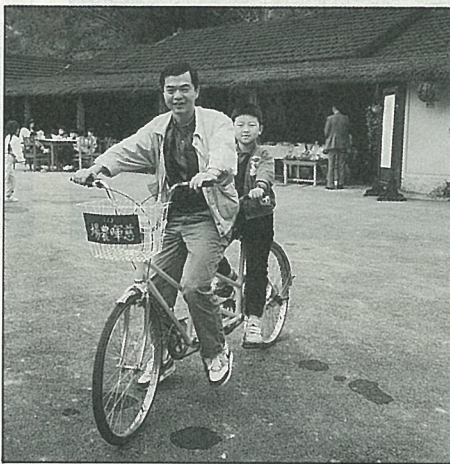
慈暉農場提供舒解身心的好去處