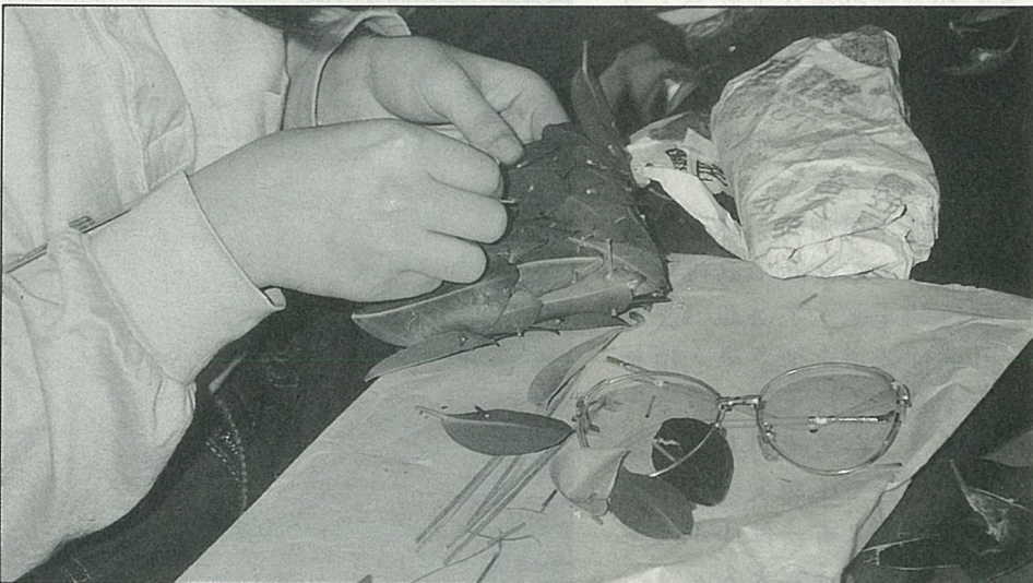
榕樹葉片編成小帽子