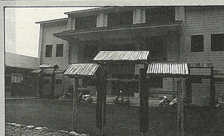
信義鄉農特產展示中心外觀