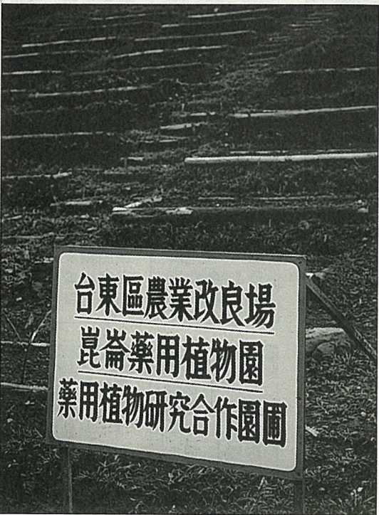
崑崙藥園與台東農改場合作的藥圃

武田藥廠，交換藥苗，並流通培植技術，以便在台灣也能栽種出杜仲、人參等寒帶藥用植物。