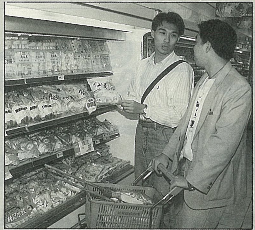
冷凍猪肉水餃國人消費數量最多

隨著冷凍貯藏設備及微波爐、電烤箱等冷凍食品烹調利器的日漸普及，冷凍食品已不僅只是大都會地區摩登、時髦的消費象徵，而深入各鄉鎮城市，緊緊與消費群眾的日常生活結合在一起。